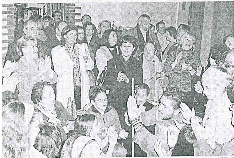
zambomba organizada por Nuestro Flamenco en El Barrio fue un éxito rotundo.