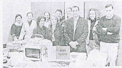
La entrega tuvo lugar en la oficina de La Caixa en Las Canteras.

En la noche de hoy jueves se desarrollarán sendas zambombas navideñas en dos establecimientos de ocio de la ciudad. De un lado está la zambomba organizada por Cafetería Cosmopolitan, a partir de las 22 horas, y en la que se contará con la actuación de El Polizquito. Y del otro, la ya tradicional organizada cada año por el Pub Quo Vadis con motivo de la Navidad y de su nueva aniversario.